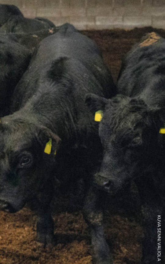
KUVA SENNI VALIOLA